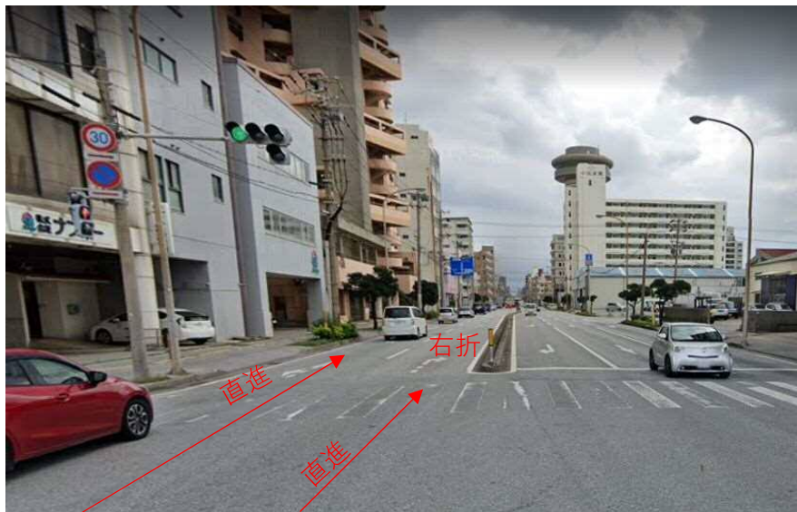
②なうら橋直進2車から直進1車に絞られている