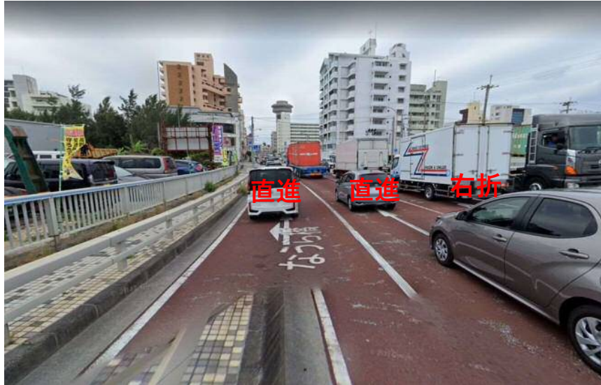
①なうら橋から曙交差点向け