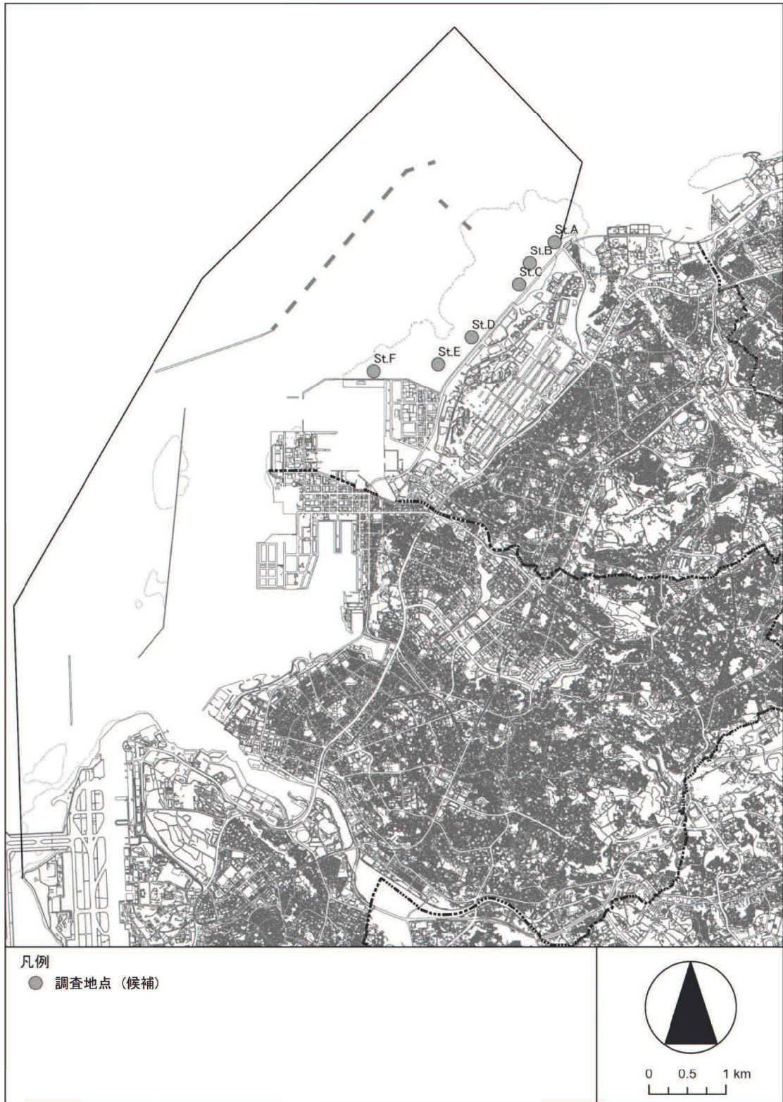
メガロベントス 調査地点(案)