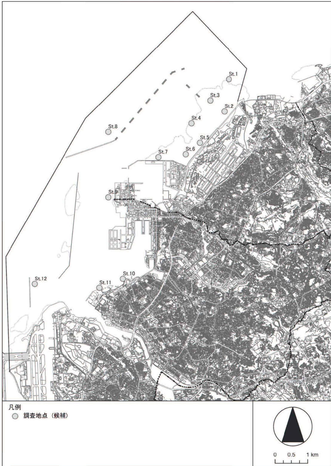
水質・底質および海域生物調査 調査地点(案)