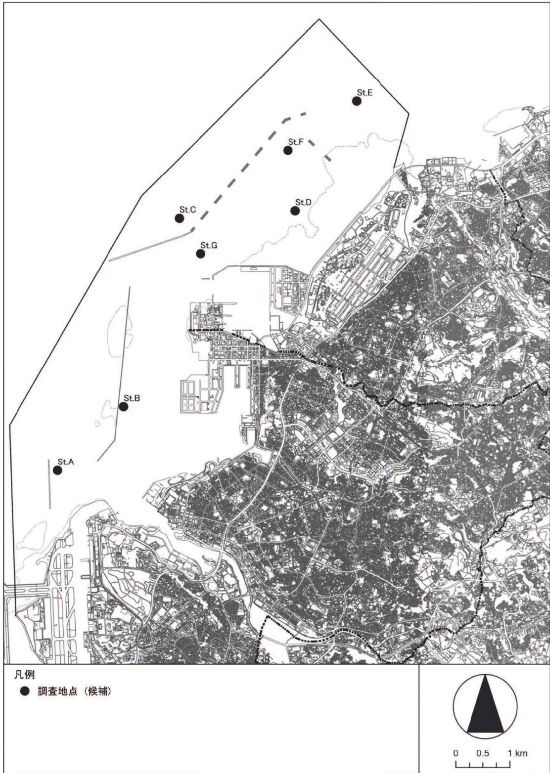
潮流調査 調査地点(案)