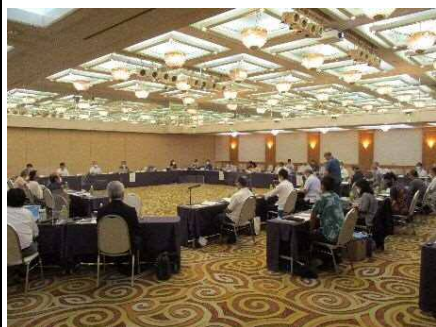
検討委員会の様子